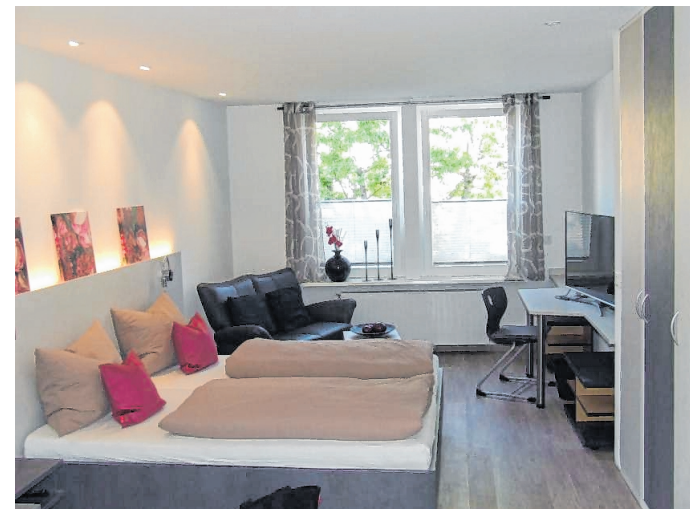
Das „Rosenzimmer“ ist nicht nur für frisch Verliebte etwas.