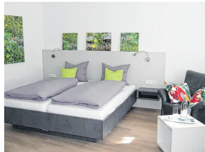
Naturliebhaber sind vom „Wiesenzimmer“ begeistert.