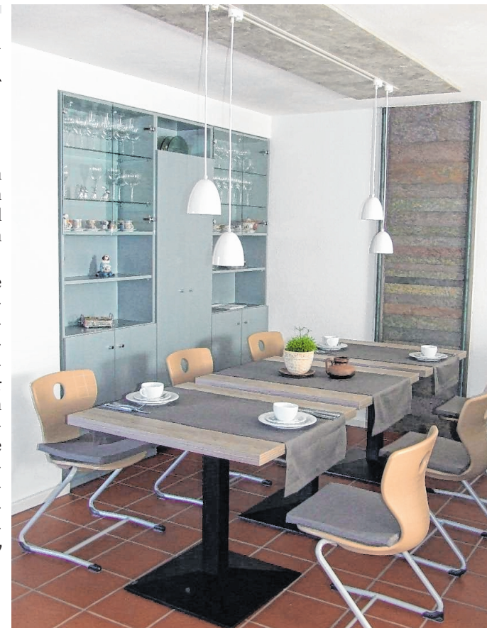
Der Blick in den Frühstücksraum macht Lust auf mehr.

i Weitere Informationen zur Pension sind unter www.pension-weedbrunnen.de erhältlich.